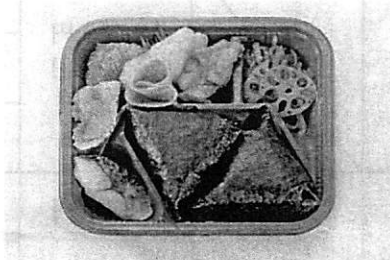
【E】おむすび弁当イメージ