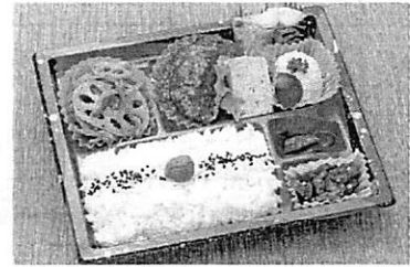
【F】日替わり弁当イメージ